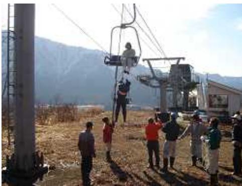
救助訓練実施状況（平成20年12月22日）

索道技術管理員・・・索道技術管理者の指揮の下、索道技術管理者の行う業務を補助する。